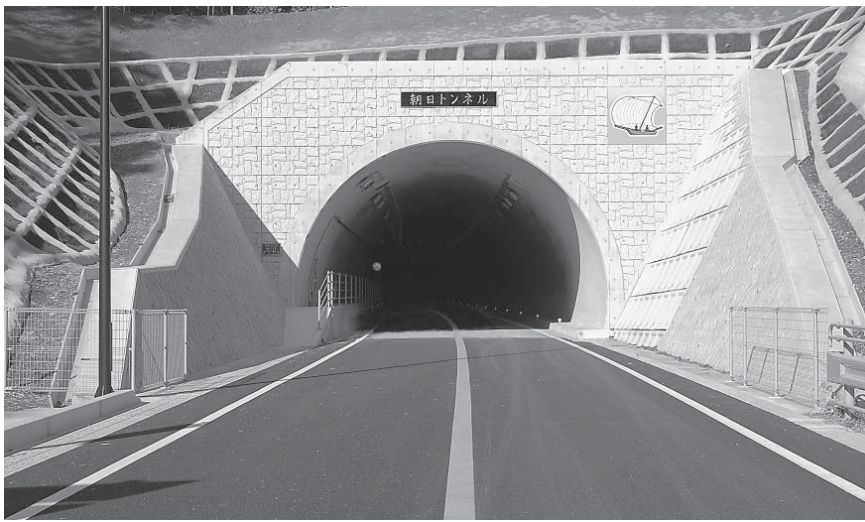
トンネル坑門部(土浦市側より撮影)

県の合併市町村幹線道路緊急整備支援事業の指定を受け、土浦市と石岡市が建設を進めてきた市道八郷新治線「朝日トンネル」(土浦市小野「旧新治村」地内～石岡市柴内「旧八郷町」地内)がこのほど完成し、12日(月)から一般供用を開始する。アクセス道路を含めた全体延長は3660m(トンネル部1784m)で、幅員9m(車道6m)の片側1車線整備。全事業費には約65億円(トンネル部約50億円)を投入した。筑波連山南東部に位置する朝日峠を越える広域農道の通称「フルツライン」は、急勾配のカーブが連続するため、通り抜けが難しく、冬季には積雪や凍結により通行が困難となっていた。峠を貫くトンネルが開通することで、大型車両を含む一般車両の円滑な交通が確保されるだけでなく、この地域における「観光」「産業」「生活」への大きく貢献するものと期待されている。