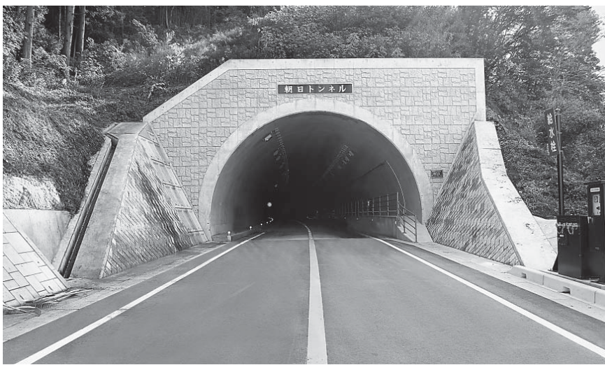
トンネル坑門部(石岡市側より撮影)